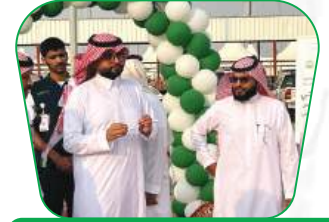
الحملة التطوعية للفحص عن الامراض المزمنة