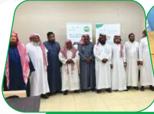
مشاركة الجمعية في الحملة الصفية للتوعية ومحو الامية