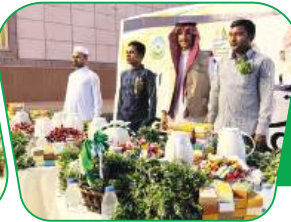
عيد الفطر المبارك