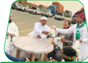
المشاركة بالاحتفاء باليوم الوطني السعودي